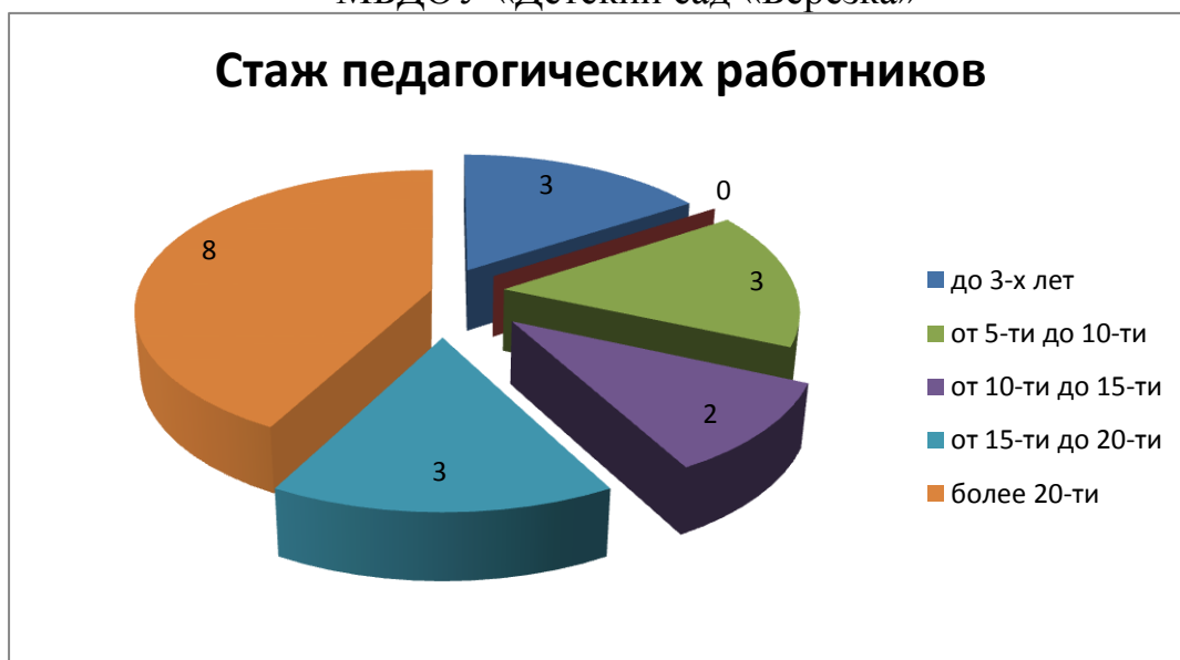
Диаграммы с характеристиками кадрового состава МБДОУ «Детский сад «Берёзка»

В 2023 году 1 педагог прошел аттестацию на соответствие занимаемой должности.